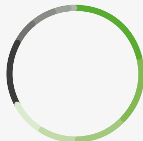
Доли владения, %