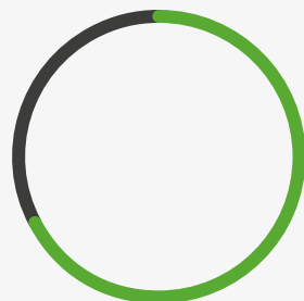
Структура капитала, %

67,337 Институциональные инвесторы 32,663 Физические лица